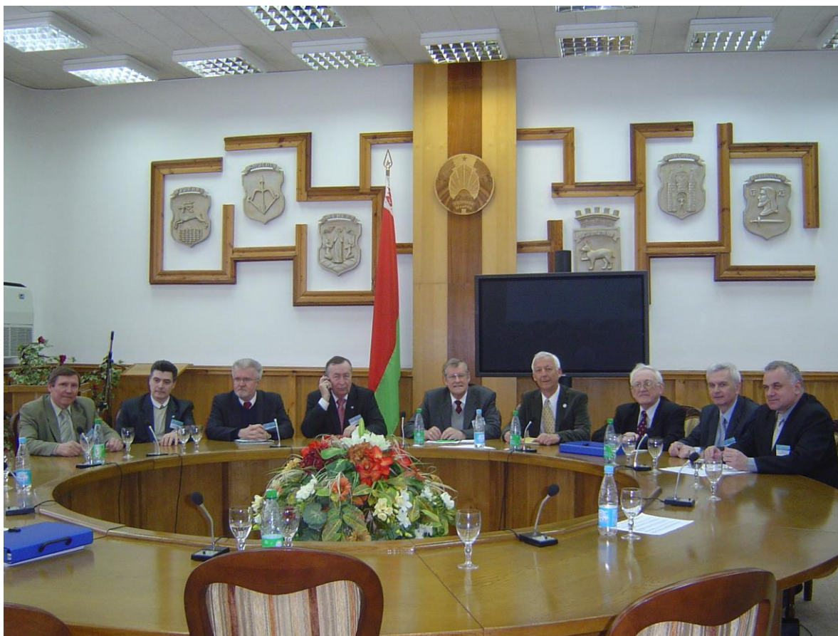
Competition jury in Minsk, 2009 Жюри конкурса в Минске, 2009 г.