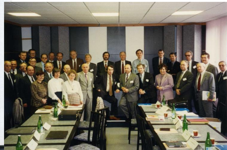
Bratislava/ Братислава 1995