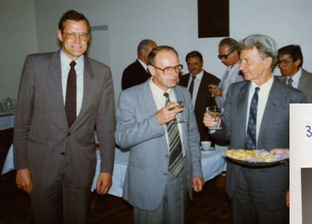
Berlin/ Берлин 1993

3. COOMET-Sitzung in Berlin - FH April 1993 (17-19.3.93)